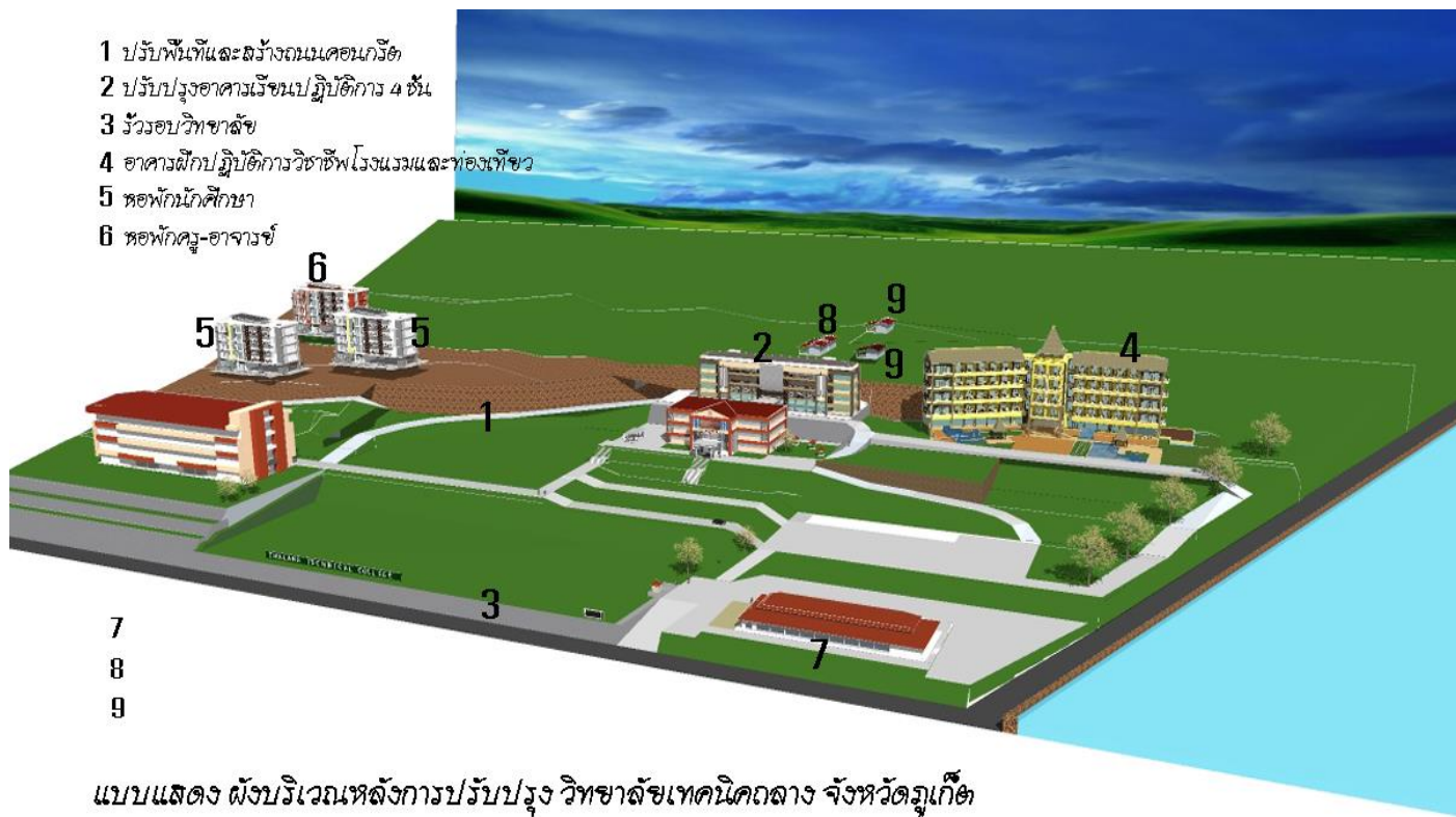
แบบแสดงผังบริเวณหลังการปรับปรุง วิทยาลัยเทคโนโลยีคลองคำ จังหวัดอุบลราชธานี